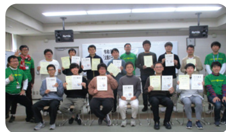
▲父親が楽しく子育てできるよう取り組みます