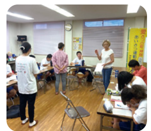
▲放課後や休日に 過ごす場所をつくります