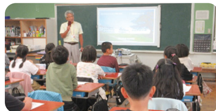
▲スマートフォンの安全な使い方を教えます